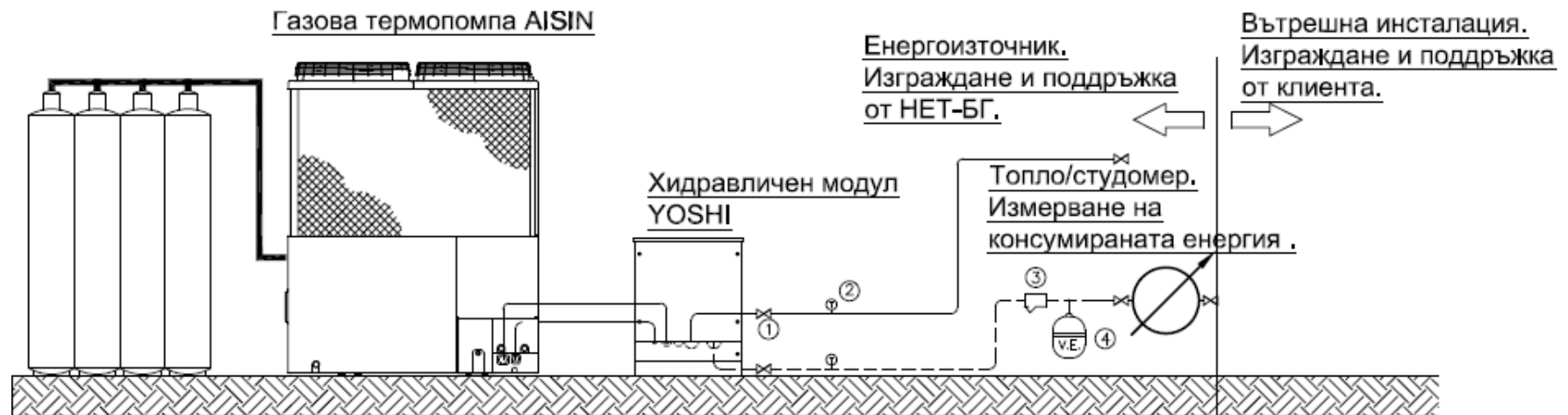
Схема на изграждане

Доставка, монтаж и сервис на газова термopомпа и хидравличен модул за сметка на NET-BG.